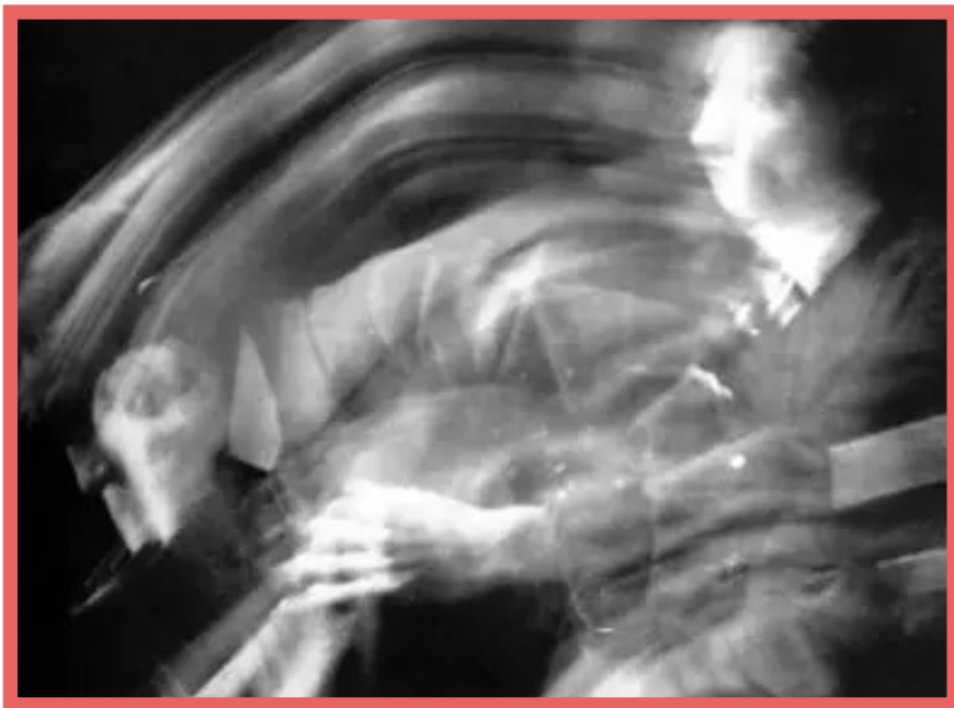
Anton Giulio Bragaglia: Mozdulatok változása, 1911

Ma már rengeteg képzőművész használja ezt a médiumot (videó). A mozgás tematikához, a Kortárs Junior foglalkozáson mi is ezt választottuk. Körülnéztünk, mi mozog körülöttünk, így hívtuk segítségül a lemezjátszót és a modellvasutat . A foglalkozás során arra törekedtünk, hogy a hagyományos technikát (lemezjátszó +modellvasút) az új média eszközeivel kombináljuk. Célunk ezzel a feladattal az, hogy merjünk nyúlni olyan eszközökhöz is, amelyekről azt gondolnánk, hogy nem alkalmasak más funkciót betölteni, mint amire hivatottak. A mozgás mint téma a MOTION foglalkozáson duplán is előkerült, ugyanis a mozgó tárgyban/tárgyon/tárgyról mozgó képet készítettünk egy hétköznapi eszközzel, a telefonunkkal. Videó utómunkákat ma már a legegyszerűbb telefonos vagy számítógépes vágóprogrammal lehet készíteni, zenét szerkeszteni hozzá. Így máris elkészülhet egy kortárs alkotás az új média eszközeivel.