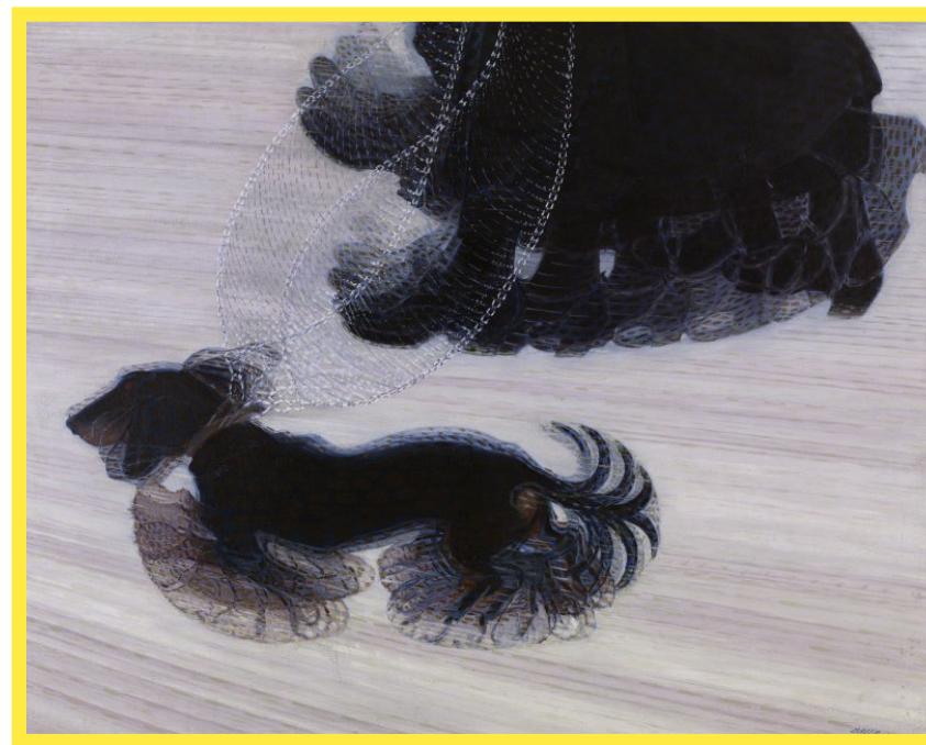
Giacomo Balla: A pórázon sétáltatott kutya dinamizmusa, 1912