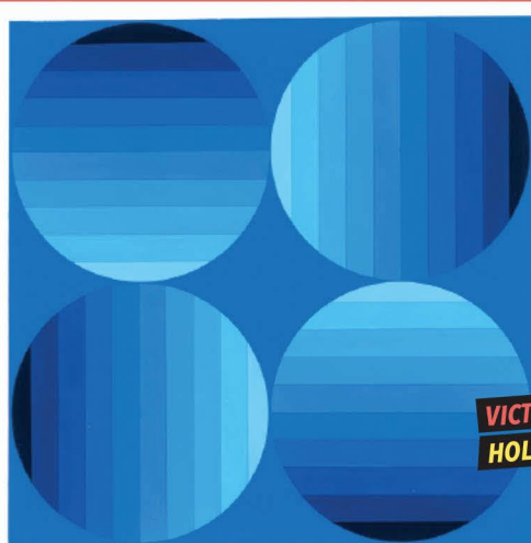
VICTOR VASARELY HOLD (1965)