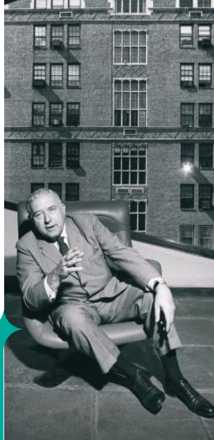
Marcel Breuer in the Whitney Museum of American Art, 1964.