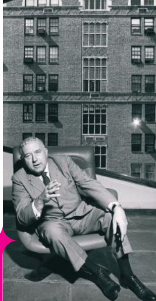
Marcel Breuer in the Whitney Museum of American Art, 1964.